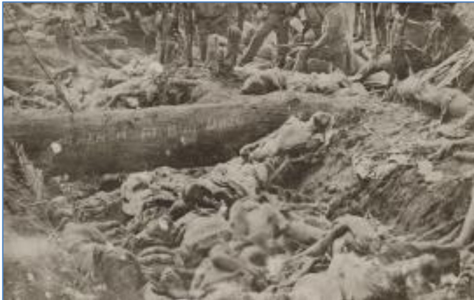
Trintserang puno ng bangkay ng mga Pilipinong Morong “minasaker” sa labanan sa Bud Dajo.